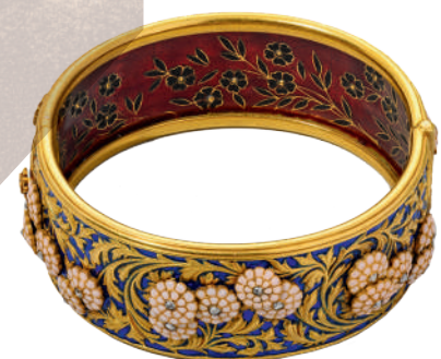
БРАСЛЕТ Франция, Париж. 1889 г. Фирма «Бапст и Фализ» Золото, алмазы, эмаль

В духе веяний моды оживляет общее впечатление многочисленность ювелирных украшений. Яркое разнообразие их форм, выполненных с чувством стиля в виде цветов, букетов, бантов, птиц, насекомых, усиливало выразительность особенно популярных среди платяных украшений брошей и булавок. Приспособились к новому костюму и традиционные запоны и пуговицы. С появлением новых силуэтов платья с декольте и укороченными рукавами расширился ассортимент нательных украшений за счет ожерелий, цепей, колье, фермуаров, кулонов, медальонов, браслетов. Широкое распространение получили и украшения для головы и волос, в частности, серьги, булавки, шпильки, гребни, тиары.