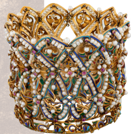
БРАСЛЕТ-МАНЖЕТ Россия, Москва. 1880-е гг. Мастерская И.Д.Чичелева Золото, рубины, жемчуг, эмаль