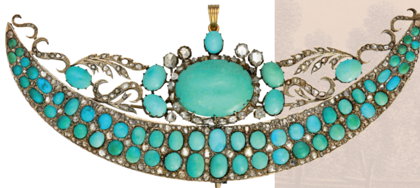
Брошь корсажная Россия. Вторая треть XIX в. Золото, серебро, алмазы, бирюза, стекла

назначенной для особых случаев: парадная и повседневная, для бала и театра, визитов, прогулок, дома. Дневные украшения выполнялись из скромных материалов и на основе личного вкуса. В то же время дорогие драгоценные камни использовались для изготовления вечерних и к торжественному случаю драгоценностей. Господствовавшими среди них были бриллианты и цветные драгоценные камни, живописные эффекты которых усиливались благодаря их свечению после огранки. Очаровывали своей новизной и открытые эпохой «стальные алмазы» и «стеклянные самоцветы», дополнившие ассортимент модных блестящих материалов ювелирного искусства.