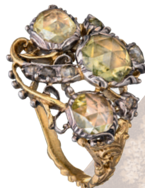
Кольцо Россия. Середина XVIII в. Золото, серебро, алмазы