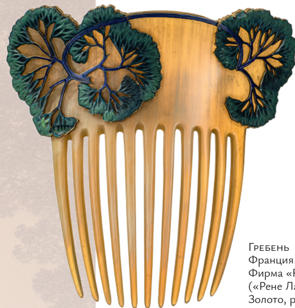
ГРЕБЕнь Франция. Конец XIX в. Фирма «Rene Lalique» («Рене Лалик») Золото, рог, эмаль

назначенной для особых случаев: парадная и повседневная, для бала и театра, визитов, прогулок, дома. Дневные украшения выполнялись из скромных материалов и на основе личного вкуса. В то же время дорогие драгоценные камни использовались для изготовления вечерних и к торжественному случаю драгоценностей. Господствовавшими среди них были бриллианты и цветные драгоценные камни, живописные эффекты которых усиливались благодаря их свечению после огранки. Очаровывали своей новизной и открытые эпохой «стальные алмазы» и «стеклянные самоцветы», дополнившие ассортимент модных блестящих материалов ювелирного искусства.