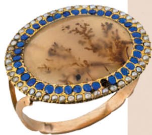
Кольцо Россия. Последняя четверть XVIII в. Золото, агат моховой, стекла, жемчуг

Драгоценности второй половины XVII – начала XX века из музейного собрания полноценно представляют ювелирное многообразие эпохи Нового времени с ее увлечениями и культурными предпочтениями. Именно в эту эпоху постепенно формировалось новое отношение к ювелирным украшениям, которые становились все более важным элементом эстетической привлекательности человека, чуткого к постоянным переменам моды и стилей в искусстве. Современный ювелирный этикет все более соответствовал типам модной одежды, пред-