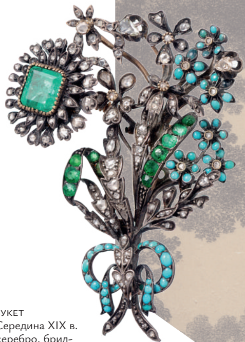
Брошь-букет Россия. Середина XIX в. Золото, серебро, брил- лиант, алмазы, изумруд, стекла, бирюза

ВЫСТАВКА «ОЧАРОВАНИЕ КРАСОТЫ. ИЗ ИСТОРИИ ЮВЕЛИРНЫХ УКРАШЕНИЙ В РОССИИ» – ЭТО ПЕРВЫЙ МАСШТАБНЫЙ ПОКАЗ ЧАСТИ БОЛЬШОЙ КОЛЛЕКЦИИ ЮВЕЛИРНЫХ УКРАШЕНИЙ ИЗ СОБРАНИЯ ОСОБОЙ КЛАДОВОЙ ГОСУДАРСТВЕННОГО ИСТОРИЧЕСКОГО МУЗЕЯ.